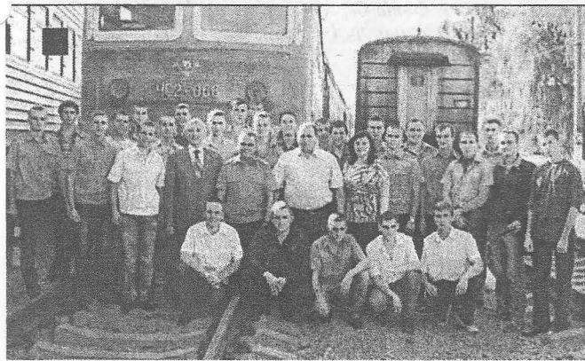
Студенти-електрики на практиці в локомотивному депо

Отже, обирай шанс весело та активно провести літні канікули,