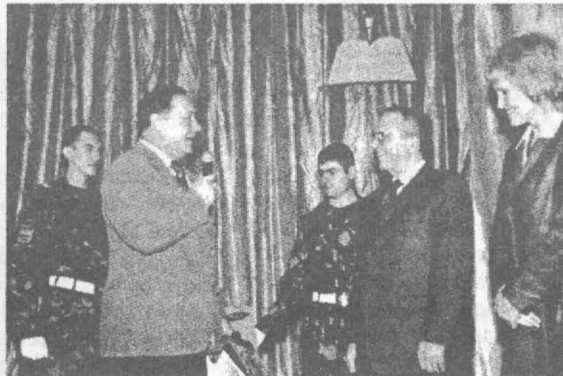
Кращий факультет - ПЦБ

Заключним етапом цієї події року стала церемонія нагородження переможців, яка відбулася 23 лютого 2005 р. в Палаці студентів. Вшанувати кращих з кращих прийшла величезна кількість викладачів, співробітників, студентів, рідних, знайомих та друзів головних героїв свята. Їх