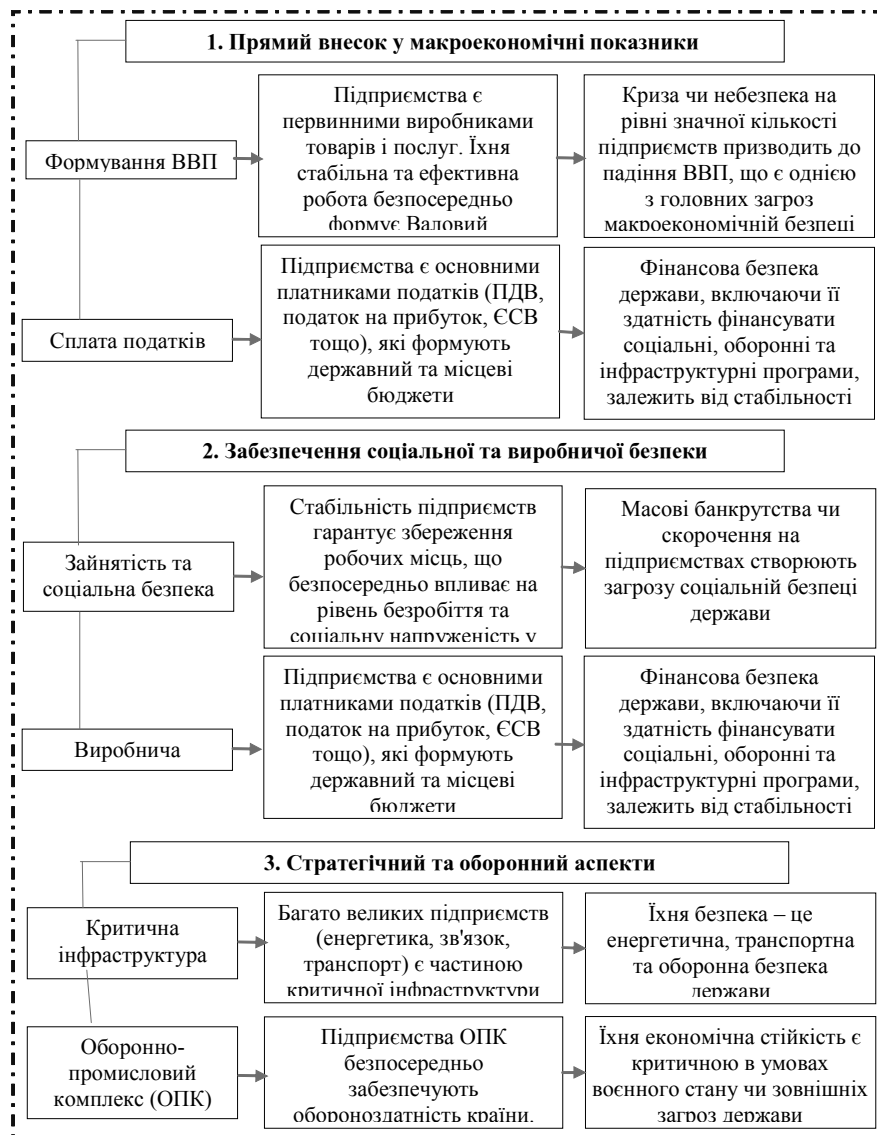
Рис. 2. Модель взаємозв'язку економічної безпеки держави та економічної безпеки підприємства