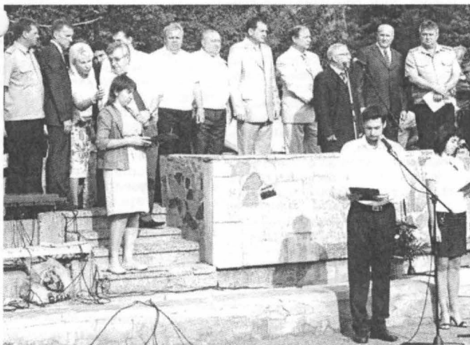
Ректорат и гости праздника

Торжественная часть сопровождалась выступлением творческих коллективов, а также дефиле оркестра. Затем состоялось возложение цветов к памятнику студентам-воинам.