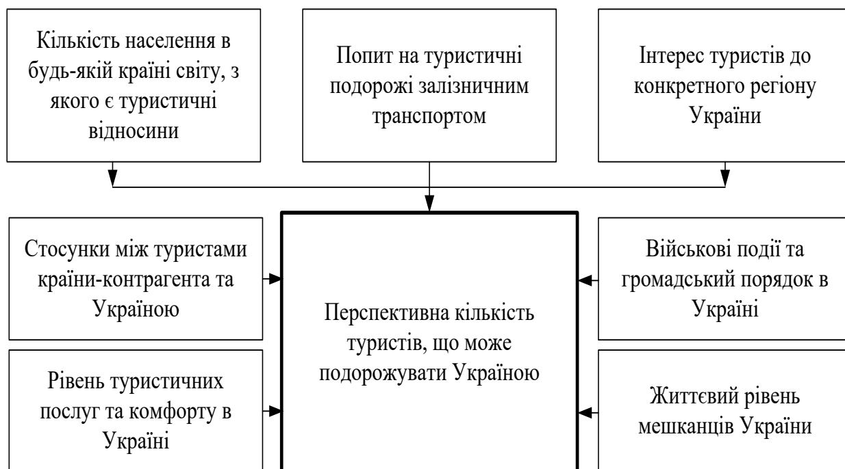
Рисунок 3.3. – Основні фактори, що впливають на попит туристів

Отже, задля успішного розвитку та функціонування українських підприємств з надання послуг міжнародного туризму, потрібно сформувати такий механізм управління, який би забезпечував досягнення високого рівня конкурентоспроможності.