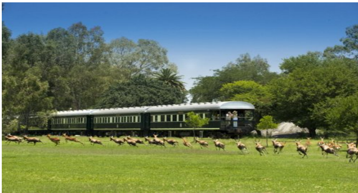
Рисунок 2.5. – Поїзд «Гордість Африки»

Туристичні перевезення залізницею є і в Австралії. Тут туристам пропонують три маршрути. Найвідоміший туристичний поїзд має назву «Ган», він працює вже більше 40 років (рис. 2.6). За дві доби пасажери відвідають місто Кетрін та місто Еліс-Спринг. Туристи побувають на афарі та спробують свої сили у грі в гольф. Вишукані страви, в тому числі із кенгуру складають меню вагона-ресторана цього поїзда [39, 40].