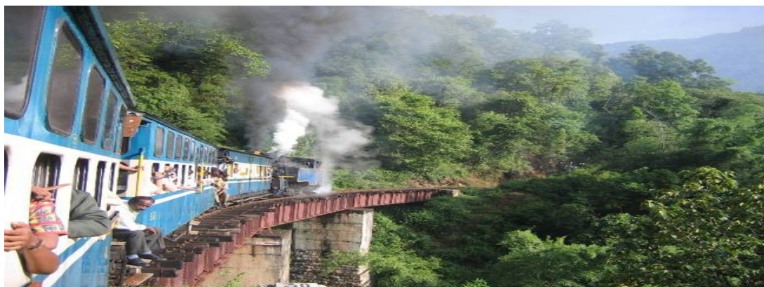
Рисунок 2.3. – Індійська туристична залізниця Нілгірі

За 6 тисяч доларів за особу пропонують проїхатися на ретро-поїзді «Палац на колесах», назва якого каже сама за себе. Поїзд обладнаний кондиційованими купе, пекарнею, вагоном-рестораном. За 5 тисяч доларів туристам пропонують тижневу подорож через усю країну на туристичному поїзді «Золота колісниця» [27, 28, 29] (рис. 2.3).