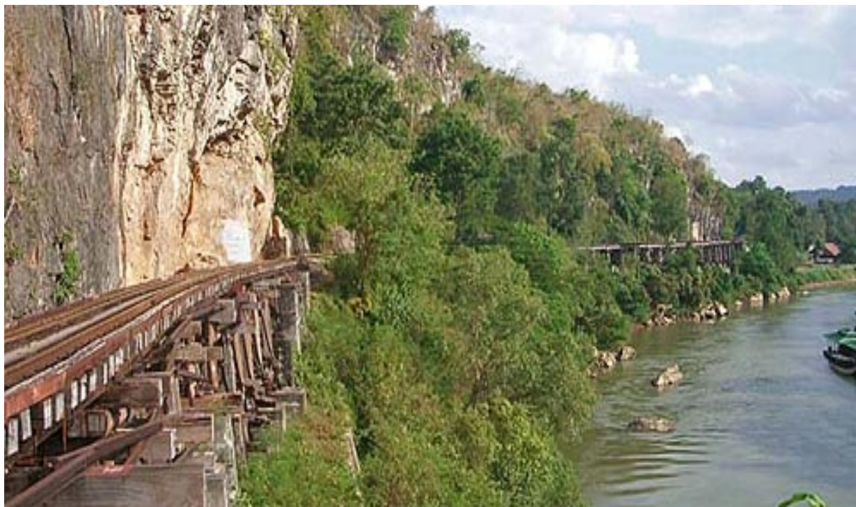
Рисунок 2.7. – «Залізниця смерті». Таїланд.

Таїландська «Залізниця смерті» приваблює туристів. Всього за 3 долари туристи отримають еличезнку порцію адреналіну, проїжджаючи повз скелі та на хитких дерев'яних містках (рис. 2.13).