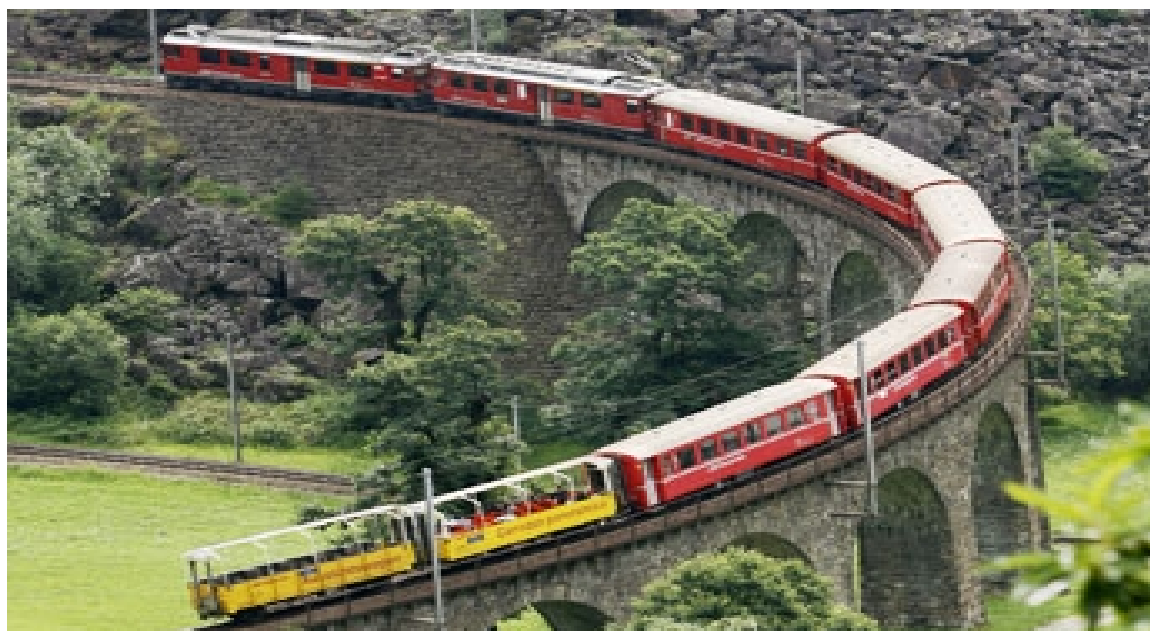
Рисунок 2.2. – «Бернинський експрес» в Швейцарії

Міжнародний туристичний залізничний маршрут долає туристичний поїзд під назвою «Експрес Берніна», проходячи через Альпи (рис. 2.2).