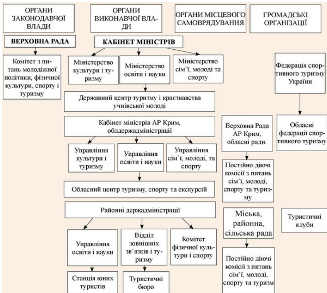
Рисунок 3.1. – Структура управління в галузі туризму. Джерело: [67].

Туристична галузь є однією із важливіших галузей, що сприяє фізичному та духовному розвитку як суспільства в цілому, так і кожного його члена окремо. Задля ефективного функціонування туристичної сфери в Україні та розвитку міжнародного туризму, в країні повинна діяти ефективна структура управління у туризмом, яка включатиме різні органи управління, що несуть відповідальність на різних рівнях та за різні напрямки організації туристичної діяльності. На даний момент в Україні працює розвинений апарат управління у туристичній сфері (рис. 3. 1).