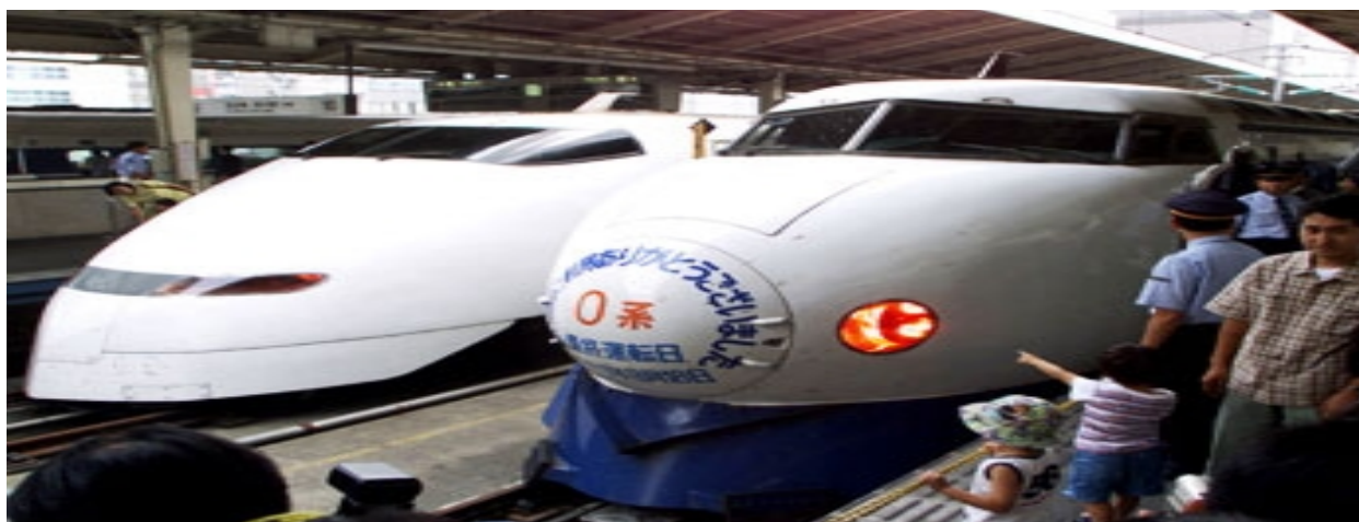
Рисунок 2.4. – Туристичні поїзди Японії

Найшвидші у світі сучасні туристичні поїзди «Сінкансен», «Токайдо», «Нодзомі» курсують в Японії [33, 34]. Вони можуть розвивати достатньо велику швидкість (рис. 2.4).