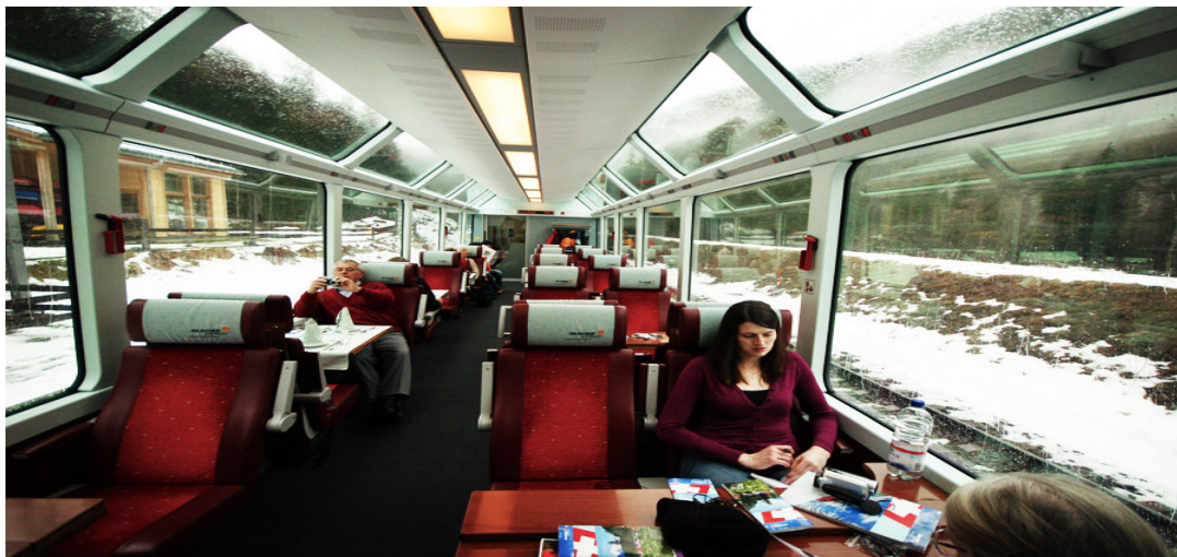
Рисунок 2.1. – «Льодовиковий експрес» в Швейцарії

«Золотий перевал», «Юнгфрау» та «Льодовиковий експрес» - це найпопулярніші туристичні поїзди, впродовж подорожі якими туристи побачать безліч мостів, тунелів, побувають на високогірні, відвідають заповідники та замки, тобто, туристам пропонуються розваги на будь-який смак (рис. 2.1).