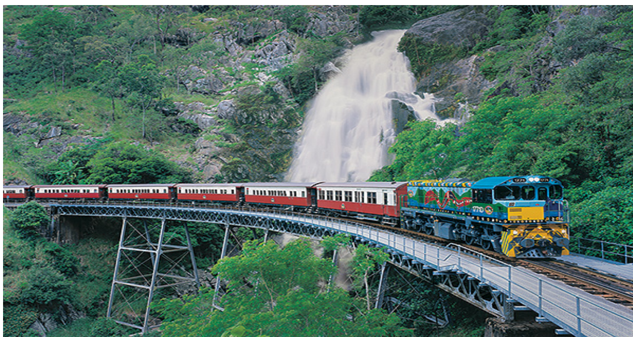
Рисунок 2.6. – Туристичний поїзд «Ган». Австралія

Туристичні перевезення залізницею є і в Австралії. Тут туристам пропонують три маршрути. Найвідоміший туристичний поїзд має назву «Ган», він працює вже більше 40 років (рис. 2.6). За дві доби пасажери відвідають місто Кетрін та місто Еліс-Спринг. Туристи побувають на афарі та спробують свої сили у грі в гольф. Вишукані страви, в тому числі із кенгуру складають меню вагона-ресторана цього поїзда [39, 40].