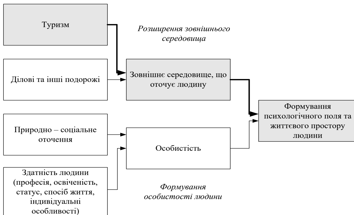
Рисунок 1.1. – Вплив туризму на розвиток особистості

Як уже зазначалося, туризм як соціально-економічне явище сформувався зовсім недавно. Саме тому теорію туризму слід сприймати і вивчати як «відкриту» систему наукових знань. Формування теорії туризму пов'язане з процесом перетворення туризму в суспільно та економічно значущий фактор економічного життя країни.