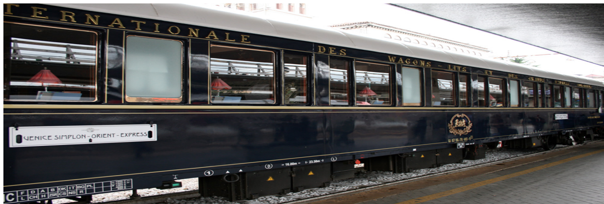
Рисунок 1.2. – Туристичний поїзд компанії «Орієнт Експрес» (Великобританія)

року «Про органи управління в галузі охорони здоров'я»; Закон CLIV від 1997 року «Про охорону здоров'я»; Закон CLXIV від 2005 року «Про торгівлю»; Закон V від 2013 року «Про цивільному кодексі».