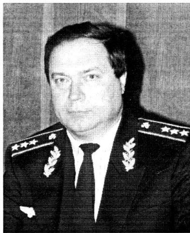
Було б дуже чудово, якби такі зустрічі стали традиційними.

Мета круглого столу була досягнута. Студенти та ректор змогли краще зрозуміти проблеми та настрої один одного. Відстань між ректором та студентами зменшилась.