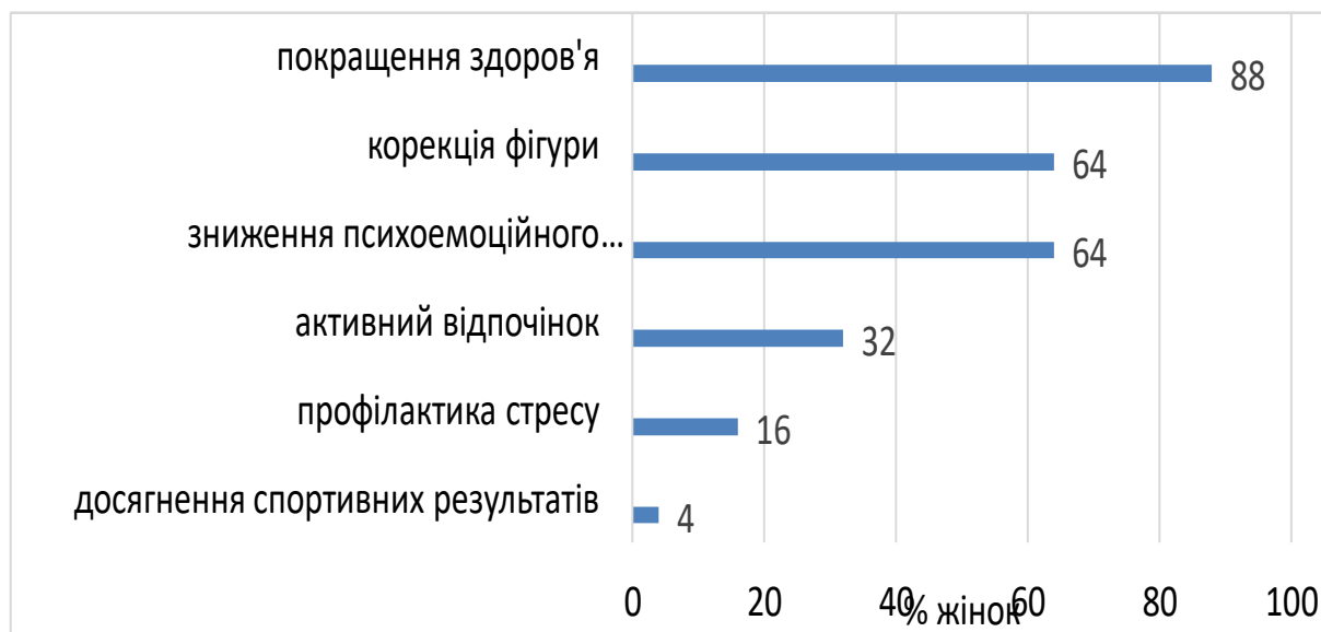
Рис. 2. Пріоритетні мотиви жінок першого періоду зрілого віку (n=50) до занять фізичними вправами, %

У ході проведеного анкетування було з'ясовано, що кратність тижневого фізичного навантаження тривалістю більше 15 хвилин у 40% жінок складає 3 рази на тиждень, 5 разів на тиждень займаються 24% жінок, 4, 2 і 1 раз на тиждень займаються по 12% опитуваних (рис. 3).