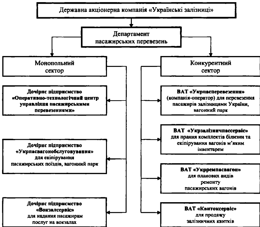
Рис. 2. Організаційна структура управління пасажирським господарством на третьому етапі структурної реформи

Якщо після розрахунків за формулою (1) залишається непогашений дефіцит пасажирських вагонів, ліквідувати його слід за допомогою заходів ефективного використання пасажирських вагонів (див. розд. 4).