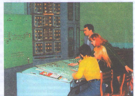
Навчальний пульт чергового по станції

Наші студенти на чолі з досвідченими науковцями мають змогу виконувати повний комплекс науково-дослідних робіт зі створення, випробування, експлуатації та ремонту рухомого складу, у тому числі й для швидкісного руху, у двох галузевих науково-дослідних лабораторіях: «Динаміка та міцність рухомого складу» та «Вагони». Завдяки високому рівню знань у сфері логістики, інтероперабельності, наші випускники, безумовно, є конкурентоспроможними серед випускників не тільки українських транспортних ВНЗ, а і європейських.