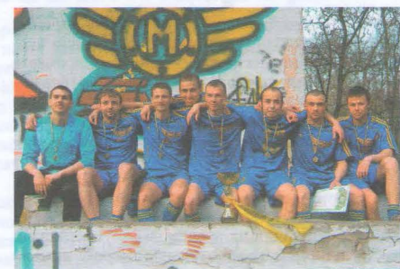
Футбольна команда механічного факультету

Зараз неможливо знайти більш важливу та багатогранну сферу діяльності, ніж економіст, який має значний вплив на ефективність виробництва, покращення життя населення та країни в цілому. Економіка – це мистецтво задоволення безмежних потреб за обмеженості ресурсів. Тому на факультеті « Економіка та менеджмент на транспорті » готують не звичайних економістів, а спеціалістів, які здобувають додаткові знання з маркетингу, з багатьох видів менеджменту та оподаткування підприємств, а також управління конкурентоспроможністю.