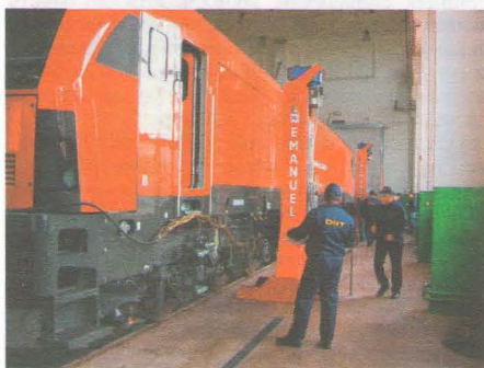
Випробування нової техніки в Литві

Підготовка спеціалістів спрямована на здобуття студентами глибоких знань з природничо-наукових, фахових дисциплін, що дає їм можливість працевлаштування на підприємствах, які займаються штучними спорудами, а також інших підприємствах будівельної галузі.