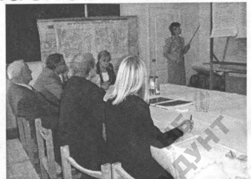
Захист дипломного проекту за спеціальністю «Інтелектуальна власність» на засіданні ДЕК