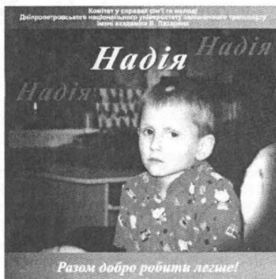
Разом добро робити легше!

Та найбільший сюрприз мешканців притулку чекав перед: їм був вручений диск із записом пісень у їх власному виконанні. Цей диск був записаний на студії КССМ на минулій їх зустрічі з активом університету і випущений під гаслом «Надія... Разом добро робити легше». Найприємніше те, що на цей захід відгукнулися студентські активи інших університетів, і це дає змогу