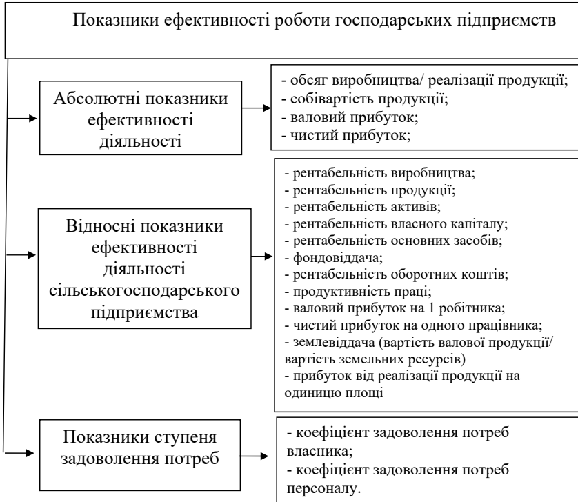
Рис. 4. Система показників ефективності діяльності господарських підприємств, що діють в галузі рослинництва