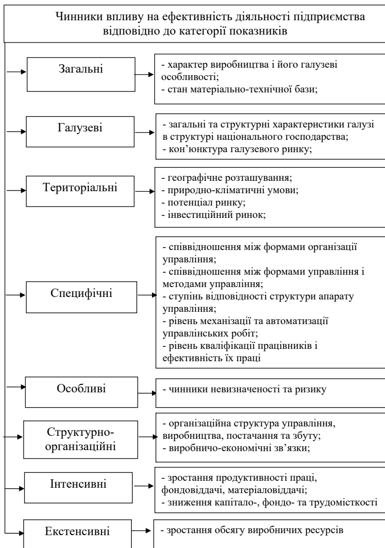
Рис. 2. Чинники впливу на ефективність діяльності підприємства відповідно до категорій показників [1; 14]