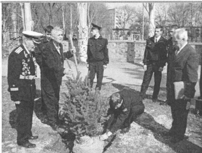
До 60-річчя перемоги у Великій Вітчизняній війні на території університету студентами і викладачами на чолі з ректором була висаджена ялинкова алея.