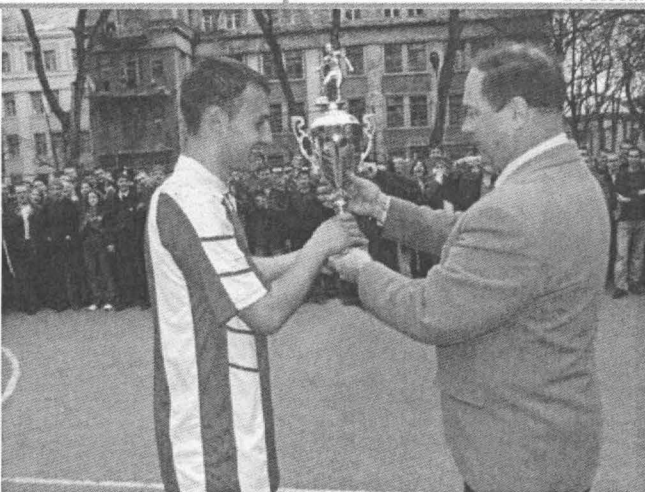
12 квітня відбулися фінальні ігри футбольного турніру серед п'ятикурсників на Кубок ректора. Перше місце з невеликою перевагою над військовою кафедрою здобула команда факультету електрифікації. А от третє місце механіки здобули переконливо, з рахунком 8:0 над командою ф-ту ТК. Переможці окрім Кубку отримали премії по 60 грн кожний.

Наказ про преміювання ректор підписав прямо на футбольному майданчику.