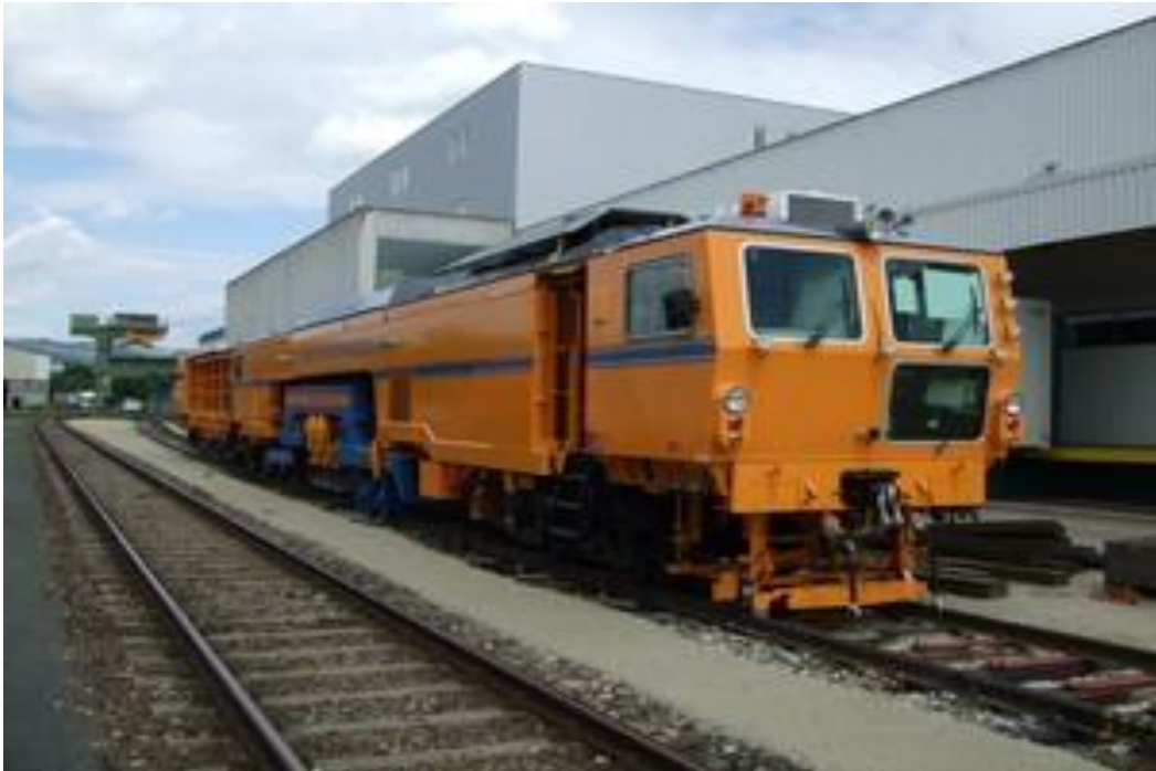
Рисунок 3.7 - Підбивальний експрес "09-3X Динамік"

DYNAMIC STOPFEXPRESS 09-3X - виправочно-підбивочно-рихтувальна машина неперервної дії, підвищеної продуктивності для одночасного підбиття трьох шпал.