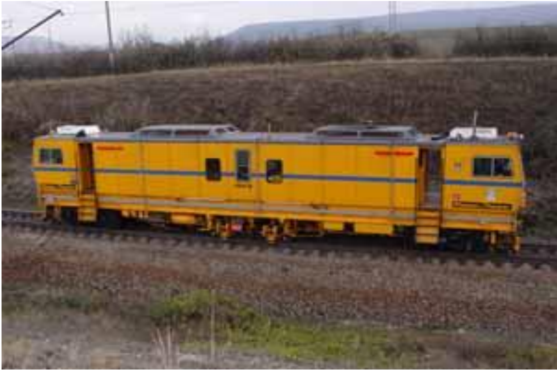
Рисунок 3.3 - Динамічний стабілізатор колії DGS 62UKR

Самохідна колійна машина DGS-62 UKR застосовується для прискореної, регульовальної і контрольованої стабілізації колії без порушення профілю, плану та рівня при всіх видах ремонту колії.