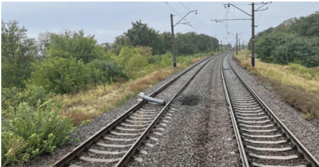
Рисунок 5.1 – Уламок на залізничній колії

Руйнування залізничних колій в Україні: наслідки повномасштабного вторгнення. З початку повномасштабного вторгнення зруйновано майже 10 тис. км залізничних колій. Цей масштабний збиток суттєво вплинув на інфраструктуру України та спричинив значні фінансові втрати.