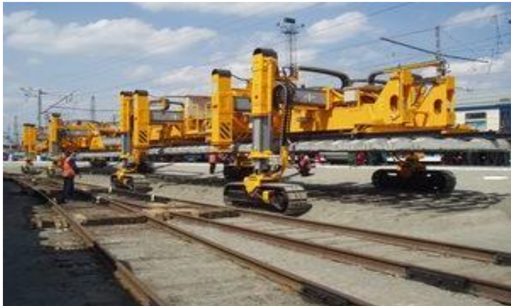
Рисунок 3.6 - DESEC TRACKLAYER TL-70

Виробник: Фірма «Plasser & Theurer», Австрія