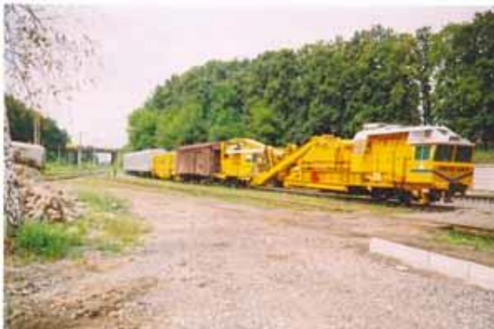
Рисунок 3.2 - Щебенеочисна машина RM-80 UKR

Щебенеочисна машина RM-80 призначена для очищення баласту при всіх видах ремонту колії, стрілочних переводів, а також для вирізки баласту при пониженні колії, без його очищення з видаленням його за межі колії або з