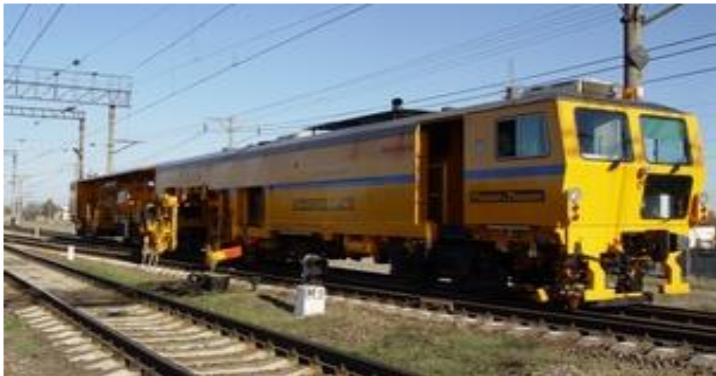
Рисунок 3.8 - Unimat 08-475 4S -8шт

Виробник: Фірма «Plasser & Theurer», Австрія