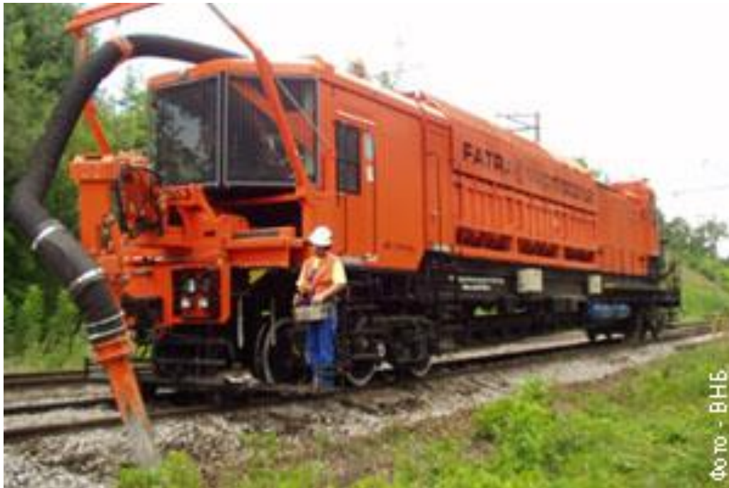
Рисунок 3.1 – Вакуумний Навантажувач Баласту ВНБ «Райлвак Фатра - 17000/У»

Машина ВНБ «Райлвак Фатра 17000/У» призначена для втягування матеріалів з колії та штучних споруд за допомогою вакууму.