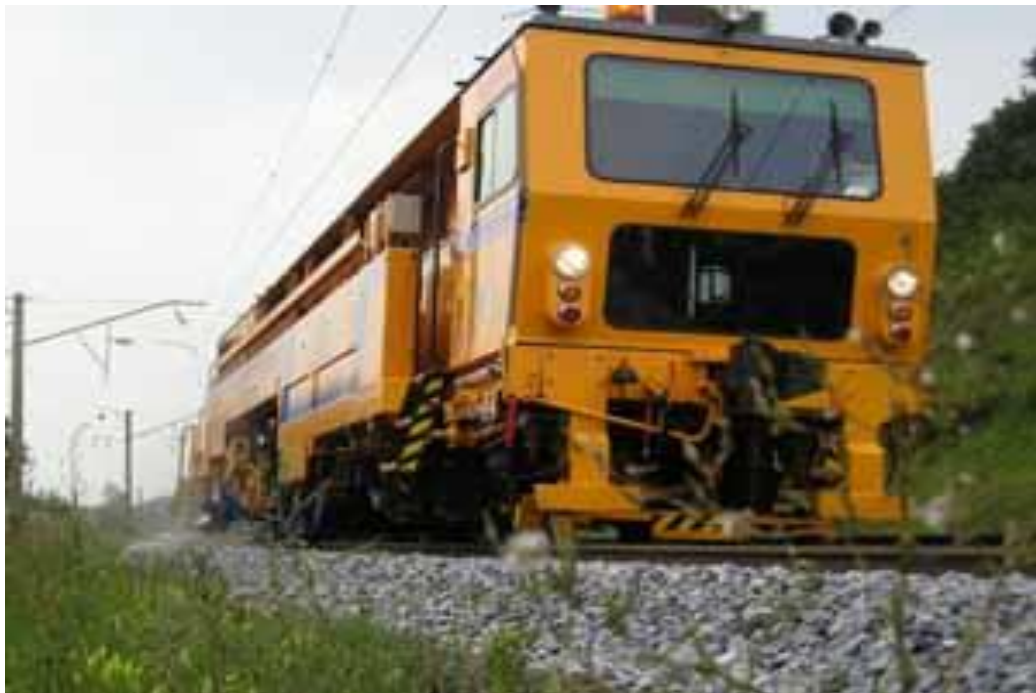
Рисунок 3.4 - Виправно-підбивно-рихтувальна машина DUOMATIC 09-32

Виробник: Фірма «Plasser & Theurer», Австрія