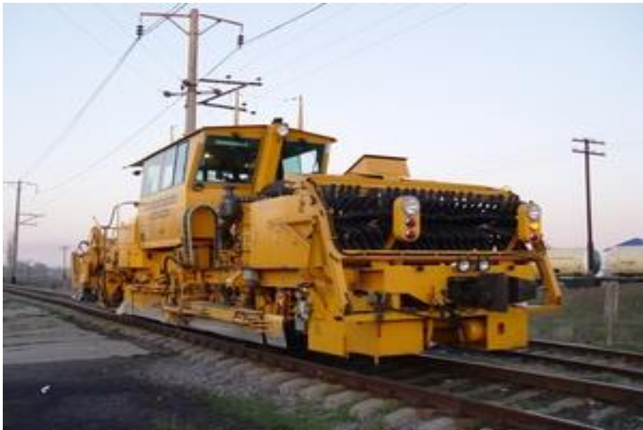
Рисунок 3.5 - Планувальник баласту SSP 110 SW

Планувальник баласту SSP 110 SW являє собою самохідну колійну машину призначену для опорядження баластної призми та може транспортувати щебінь в обох напрямках при виконанні всіх видів робіт.