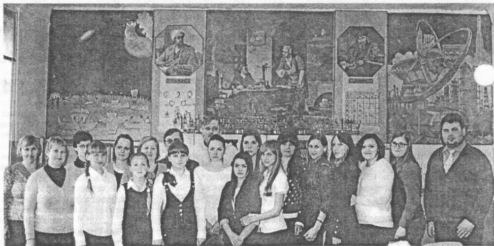
Учасники підсекції «Хімія та інженерна екологія»: учнівська молодь, студенти, вчителі та науковці

Понад дві години аудиторії кафедри «Хімія та інженерна екологія» перетворились на трибуну молодих дослідників-екологів. Мов на форумах Древньої Греції учнівська молодь та студенти презентували свої наукові розробки та дискутували щодо проблем екологічної безпеки. В доповідях студенти приділяли особливу увагу опису сучасних методів дослідження та методології організації експериментів в екології.