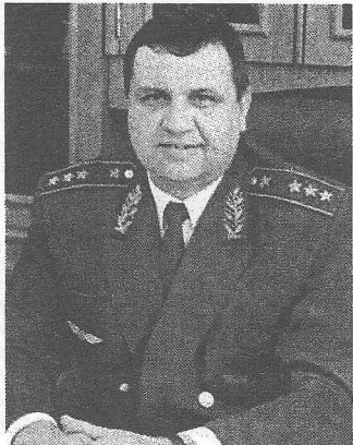
Випускник факультету «Електрифікація залізниць», народний депутат Олександр Іванович Момот

Широ вітаю вас, молодих, енергійних, сповнених мрій та сподівань, з Міжнародним днем студента! Студентство – це щаслива сходи́нка до вершин самореалізації та самоствердження, бо саме в цей період відбувається становлення особистості, пізнання тасмниць спеціальності та перетворення у висококласного фахівця. Бажаю студентам успішного здобуття знань, досягнення високого рівня професіоналізму, веселого та цікавого дозвілля, постійного прагнення до самовдосконалення! Дякую за підтримку та виявлену до мене довіру і сподіваюся на активну співпрацю зі студентським активом університету заради розвитку та процвітання нашої держави!