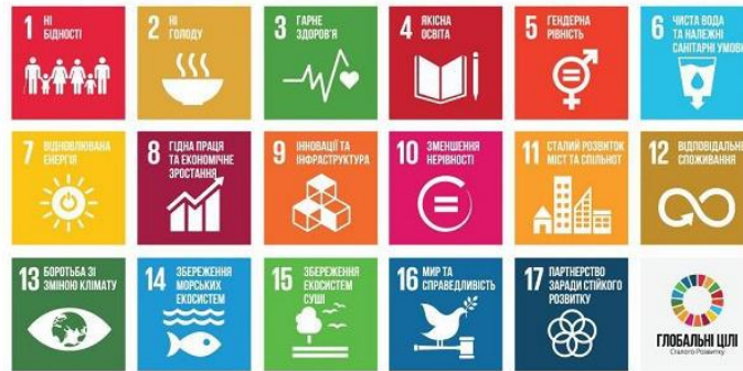
Рисунок 1 - Глобальні цілі сталого розвитку [1]

Одним із ключових бар'єрів на шляху реалізації принципів сталого розвитку залишається нестача своєчасної, достовірної та структурованої інформації про стан природного середовища, динаміку землекористування, особливості функціонування водних та лісових екосистем, а також соціально-економічні процеси. Обмеженість аналітичної інформації ускладнює формування об'єктивного розуміння екологічної ситуації, що перешкоджає прогнозуванню можливих ризиків і знижує результативність управлінських рішень на державному та регіональному рівнях.