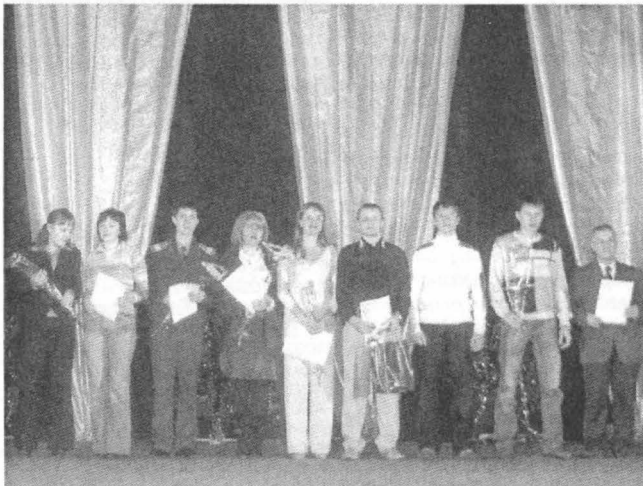
Переможці в номінації «Краща група»