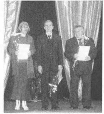
Переможці в номінації «Краща кафедра»