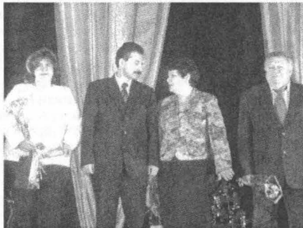
Переможці в номінації «Кращий вчений»