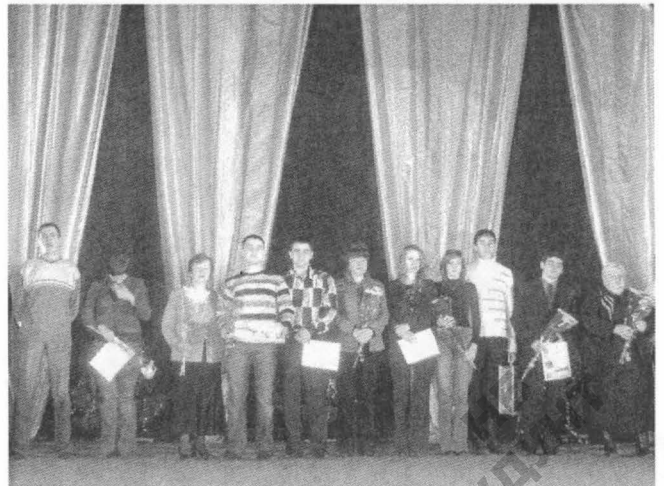
Переможці в номінації «Кращий гуртожиток»