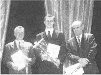
Переможці в номінації «Кращий факультет»

Еже традицією в університеті стало проведення огляду-конкурсу «Вибір року». Це і підбиття підсумків навчальної, наукової та громадської діяльності колективу, і визнання та вшанування переможців, і потужний поштовх для тих, хто відчуває в собі бажання досягти більшого.