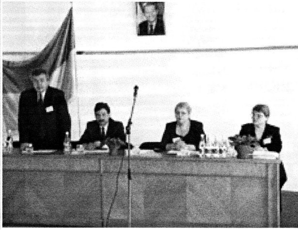
В президиуме конференции

Не новость, что овладение иностранным языком требует систематической работы. Именно поэтому мы, преподаватели, пытаемся стимулировать эту работу, и 1-я международная студенческая научная конференция на английском языке, которая прошла 15 мая у нас в ДИИТе – еще одна попытка показать, что английский является языком международного образования и науки, что английским необходимо владеть для профессионального общения. От этого во многом зависит будущее нашей науки и технического прогресса.