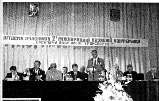
В президиуме конференции