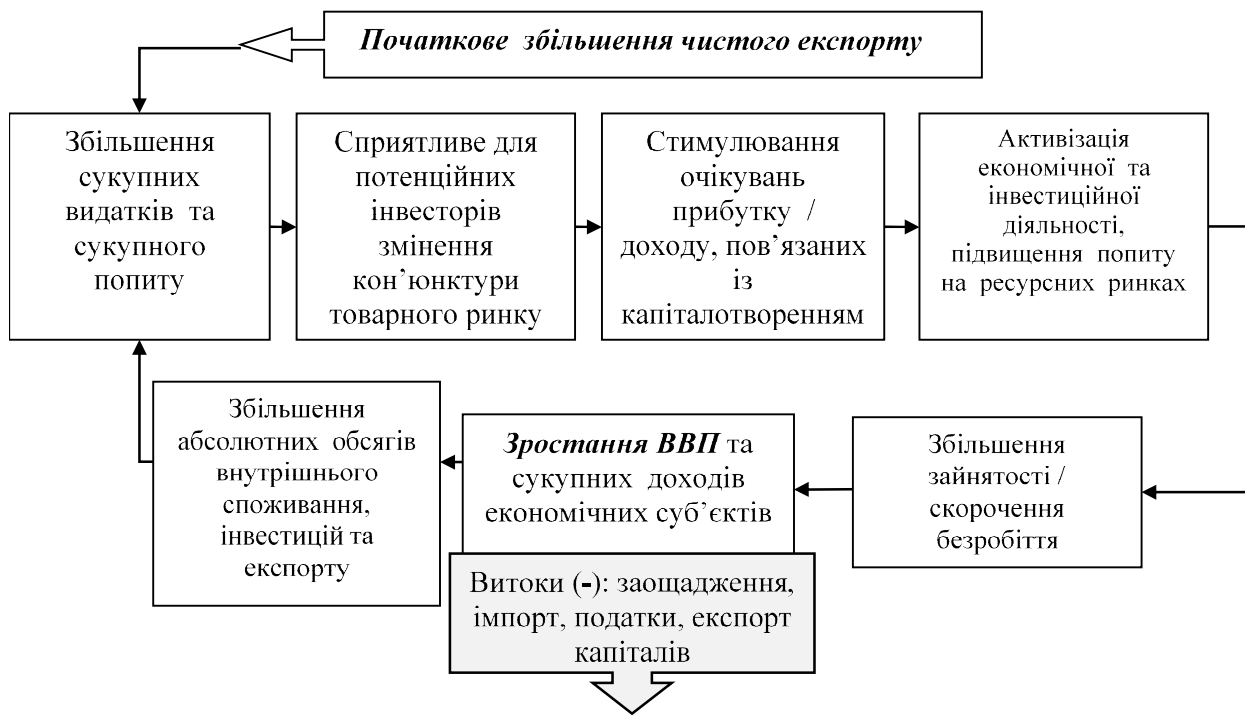
Рис. 3 - Стимулюючий механізм дії зовнішньої торгівлі ( X_n > 0 ) [розроблено авторами із використанням [4; 6]].

За допомогою мультиплікатора зовнішньої торгівлі у першому наближенні можна спрогнозувати потенційний темп економічного зростання: