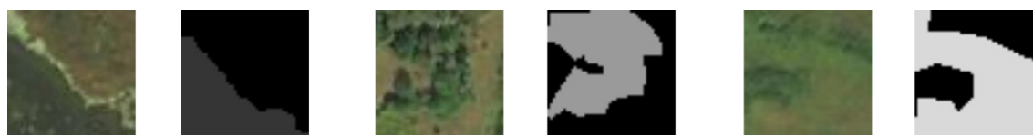
Рисунок 3 - Оброблені маски для класів: вода, дерева, поле

Для виправлення та покращення результатів, насамперед необхідно анотувати дані для навчання та створити більш детальні маски для кожного класу.