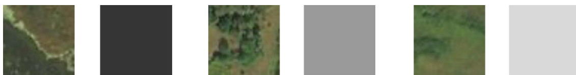
Рисунок 1 - Необроблені маски для класів: вода, дерева, поле

Метою дослідження є покращення розпізнавання супутникового зображення місцевості задля цього проведені декілька етапів з покращення первинних даних які використовують для навчання нейронної мережі. Спочатку використовуємо найбільш необроблені дані (без анотування) та запускаємо навчання нейромережі для розуміння, чи необхідні подальші етапи або чинного результату більш ніж достатньо.