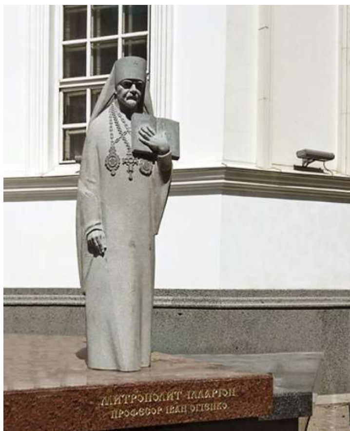
Пам'ятник Івану Огієнку (митрополиту Іларіону), 2017 р., Житомир Скульптор Василь Фещенко