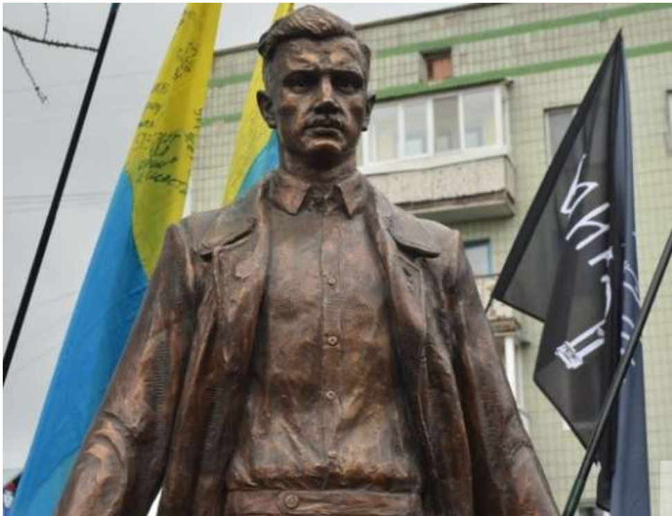
Пам'ятник Олегу Ольжичу, 2017 р., Житомир Скульптор Василь Фещенко