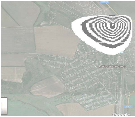
Fig. 3. Spatial distribution of NH3, t = 70 \text{ sec} (level z = 10 \text{ m} )