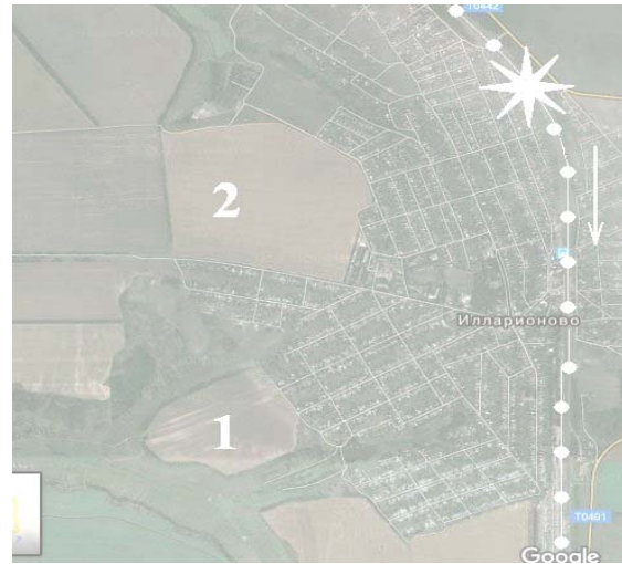
Fig. 1. Satellite image near Railway Station « Illarionovo » : 1 – Site # 1 (farm field); 2 – Site #2 (farm field); dots show the rail way track; « star » shows the initial point of emission

The developed generic code « EMISSION » was used to solve the following problem. A train with toxic chemical (NH 3 ) moves near Railway Station « Illarionovo » (Dnipropetrovsk Region, Ukraine) and at time t=0 the instant emission of NH 3 takes place. This emission results in NH 3 cloud formation (Fig.2). Position of this instant emission is schematically shown as «star» in Fig.1 and «arrow» indicates the direction of the train movement. The train keeps moving after the accident and long term emission of NH 3 ( q = 5 \text{ kg/sec} ) follows the instant emission. So we have scenario « instant exhaust of toxic chemical + long term emission of it ».